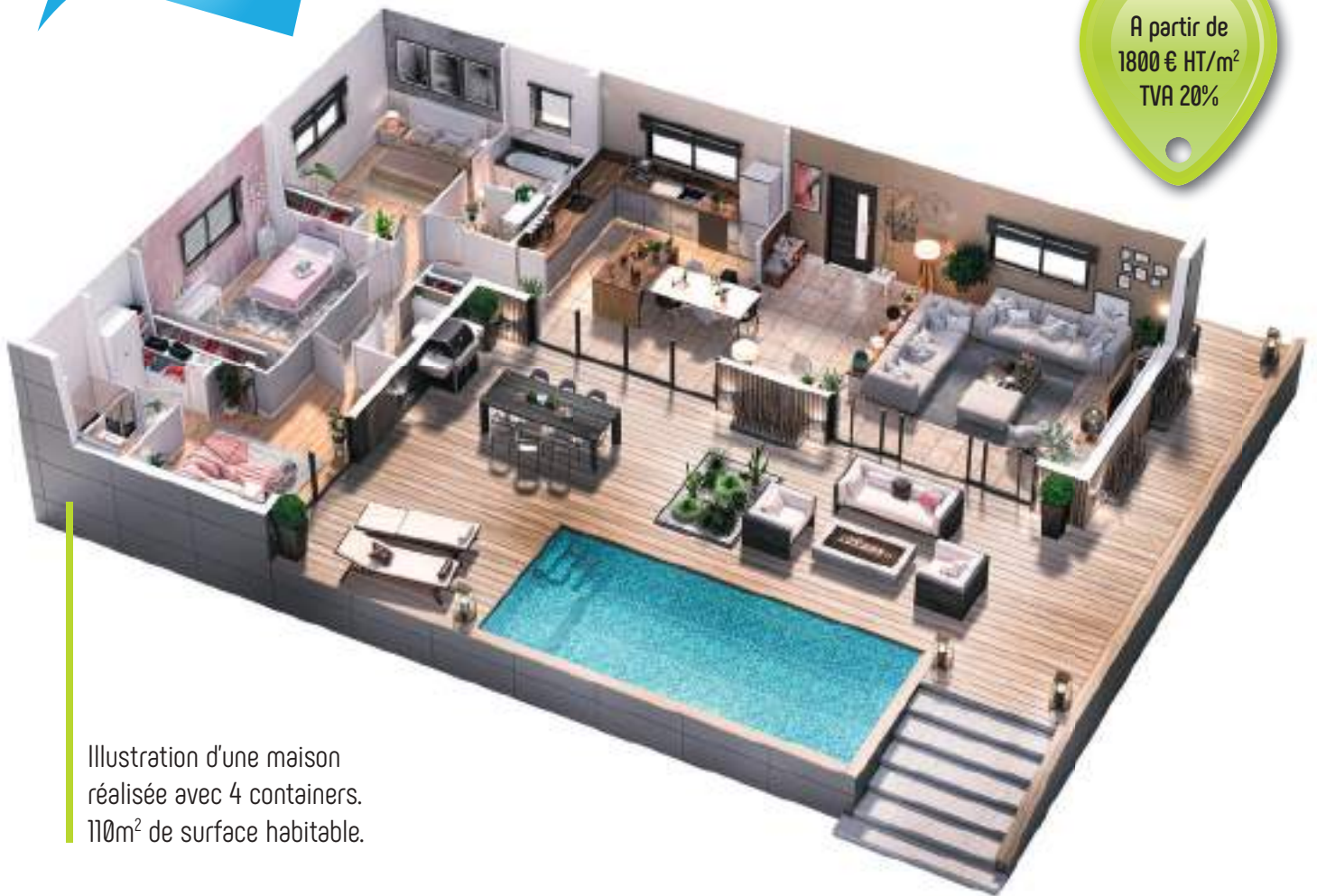
Illustration d'une maison réalisée avec 4 containers. 110m 2 de surface habitable.